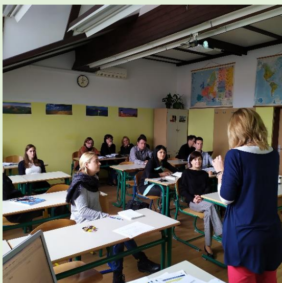
Učiteljski zbor pripravlja akcijski načrt

Učitelji mentorji smo akcijski načrt za izvedbo projekta načrtovali že med poletnimi počitnicami, zato smo takoj v začetku septembra 2019 začeli z navduševanjem dijakov za naš Erasmus+ projekt. V enem mesecu smo že imeli zbrane vse prijavnice, motivacijska pisma, opravljene razgovore, imeli smo tudi uvodni operativni sestanek z vsemi novimi Erazmovci. Te aktivnosti smo morali opraviti učinkovito, saj je bila naša prva mobilnost že dva meseca po začetku projekta.