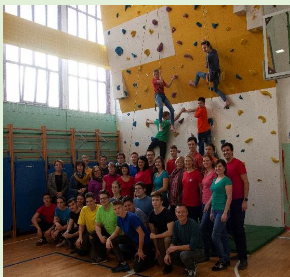
Ekipa Erazmovcev, dijakov in učiteljev, v šolski telovadnici jeseni 2019